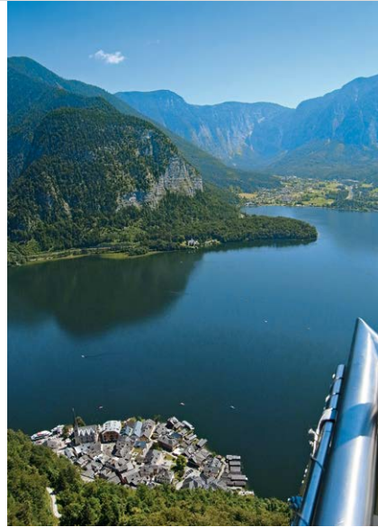
Die Stufen hinab erreichen wir ...