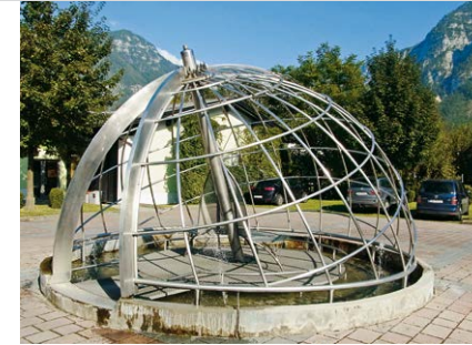
Der besondere Brunnen in Obertraun.

Von der Bergstation dieser Seilbahn auf den 2108 m hohen Krippenstein (Zugabeta!) hat man die Möglichkeit, bei einem Spaziergang weitere Sehenswürdigkeiten zu besuchen, wie z.B. die »5fingers«-Aussichtsplattform mit Tiefblick auf den Hallstätter See, die Welterbespirale mit dem Selfie-Fotopoint, viele raffinierte Liegebänke, den Dachsteinhai sowie die kleine, frei zugängliche Krippenstein-Eishöhle. Diese beiden letztgenannten Highlights finden wir auf der markierten Strecke der letzten SalzAlpenTour. Das knapp 3000 m hohe Dachsteinmassiv dominiert bei diesem Ausflug auf den Krippenstein das grandiose 360-Grad-Panorama. Ein früher Start ist bei diesem Ausflug, der die Wandertage auf eine besondere Weise abrundet, empfehlenswert!