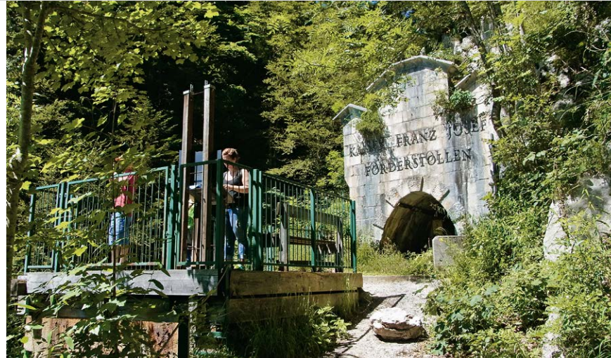
Das Salzbergwerk in Hallstatt hat ein weit verzweigtes Netz an Förderstollen.

i Gegenüber sehen wir den Krippenstein , zu dem ab Obertraun eine Seilbahn hochfährt. Wer genau hinschaut, kann die Kapelle und die Welterbespirale auf seinem Plateau erkennen. Auch die Aussichtsplattform »5fingers« mehr links (beim Sendemast) kann man vage ausmachen.