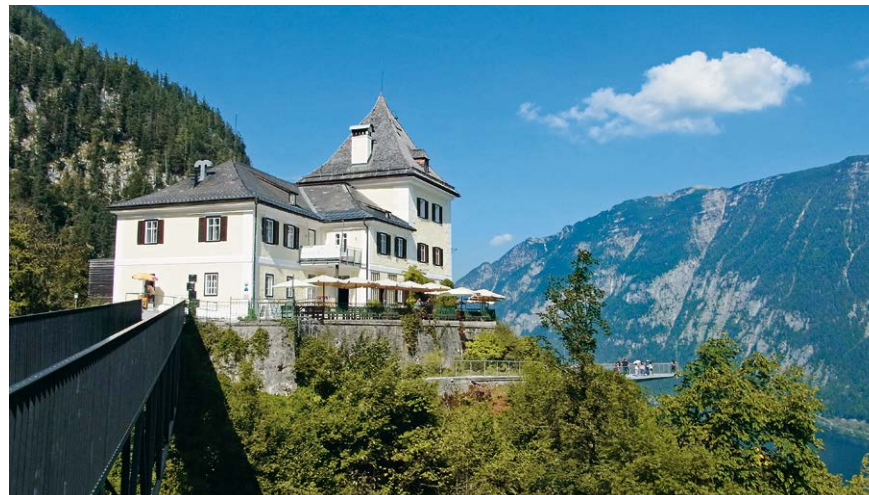
Rudolfsturm mit Gaststätte und Museum, rechts der Skywalk.

i Den Bilderbuch-Blick von Lahn über den See hinüber nach Hallstatt sollte man sich auf keinen Fall entgehen lassen – er lohnt sich wirklich.