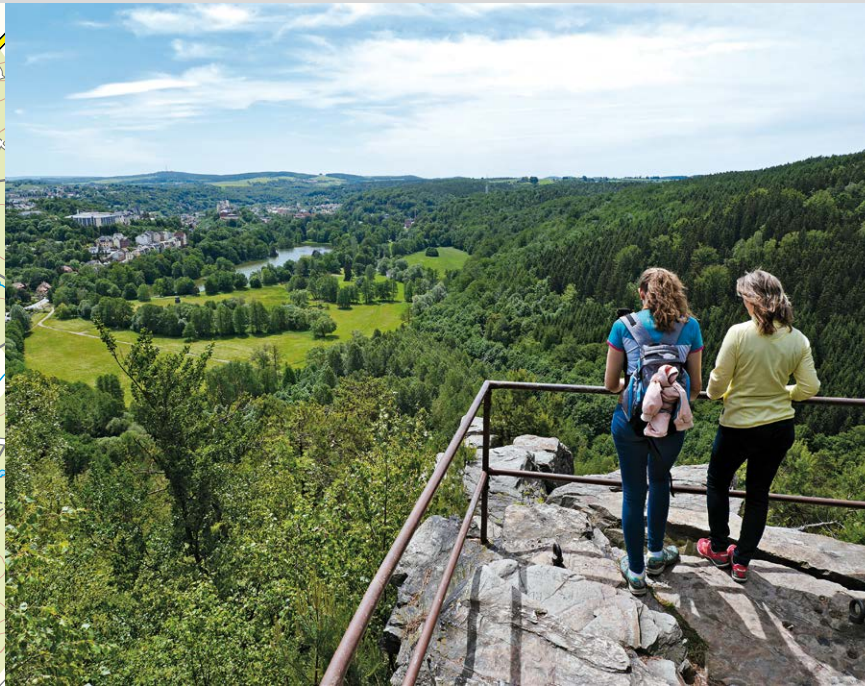
Blick vom Weißen Kreuz zum Greizer Park.

auf die Häuserfassaden an der Weißen Elster. Nach der Brücke zweigen wir links ab Richtung Sommerpalais und nehmen den Südeingang des Parks. Im schönen Greizer Park passieren wir die Parkgärtnerei und gehen danach rechts ab, um gleich wieder rechts abzuzweigen. Wir erreichen eine Gedenkstätte, welche an die Opfer von Gewalt und Krieg erinnert. Das Ehrenmal wurde 1787 ursprünglich als Porzellanrotunde erbaut und hatte die japanische Porzellansammlung des Fürsten Heinrich XI. von Reuß-Greiz aufgenommen. Am Ehrenmal links gehen und im Greizer Park auf diesem Weg bleiben. Wir passieren den schön gelegenen Parksee und interessante Baumbepflanzungen – unter anderem eine Sumpfcypresse, deren Wurzeln um den Stamm herum so aus dem Boden ragen, als wäre hier eine Murmel-tierfamilie erstarrt. An einem T-Abzweig gehen wir rechts. Wir verlassen das Naturdenkmal und passieren vorsichtig die Schienen einer aktiven Bahnstrecke. Von hier aus ist der Pulverturm in erhöhter Lage zu sehen und linker Hand das Weiße Kreuz. Wir gehen an der Autostraße links Richtung Weißes Kreuz und folgen nun der Wegbeschilderung Elsterperlenweg (EPW). Nach