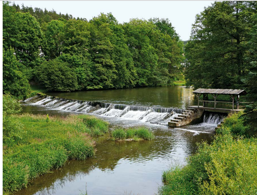
Der Flusslauf der Weißen Elster in Neumühle.

Wir gehen geradeaus weiter den Elsterperlenweg (sowie Roter Punkt auf weiß) Richtung Neumühle. Es geht nun wieder etwas bergab, und wir lassen